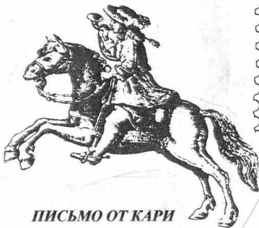
ПИСЬМО ОТ КАРИ

Письмо, видимо, 76г. летнее, из Сестрорецка. М.б. прислано в Арпачин, в Донскую экспедицию, м.б. позже в Москву, не помню. (Упомянуты археологические реалии). На страничках школьной тетради в клетку.