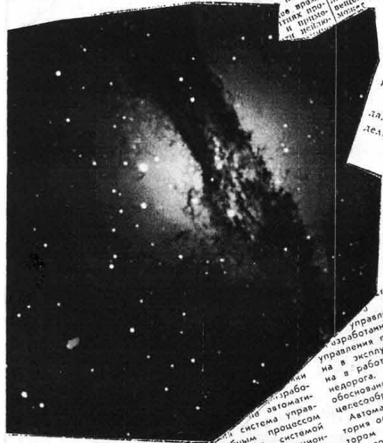
14. Гигантская планетарная туманность NGC7293 в Водолее.

У kota - муркота Была мачеха лиха Она бида kota Приговаривала Не ходи котик По чужим дворам Не качай котик Чужих деточек Ну а я тебе коту За работу заплачу Дам кувшин молока И кусок пирога